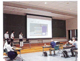
SRH中間発表会 (理数探究コース2年)

年間を通して理科・数学分野の課題研究に取り組みます。大学の先生方に指導・助言をいただき、校外での成果発表も行います。