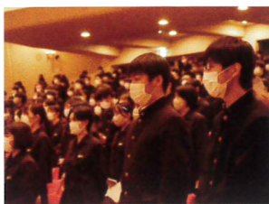
学校創立60周年記念式典

2022年に学校創立60周年を迎え新たな一歩を踏み出した「さわやか三高」は、生徒、保護者、地域のさらなる期待に応えるために、その使命として、時代と社会の未来を担う「瞳輝くリーダーを育てる」学校であること、そして、生徒個々の目標を実現できる「夢を叶える学校」であることを目指していきます。